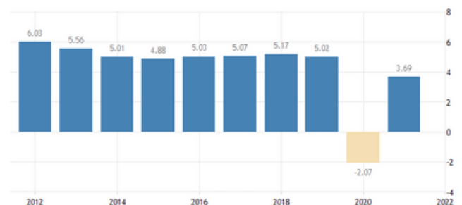
Grafik 1.2 Pertumbuhan Ekonomi Indoensia (BPS, tradingeconomics)